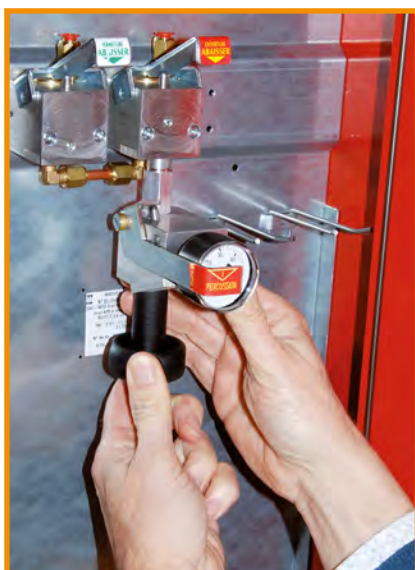
Monter le TCP