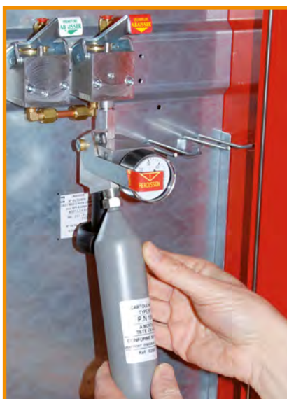
Monter la cartouche