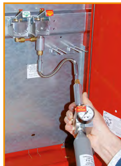
Si nécessaire, intercaler le raccord flexible pour espace réduit.